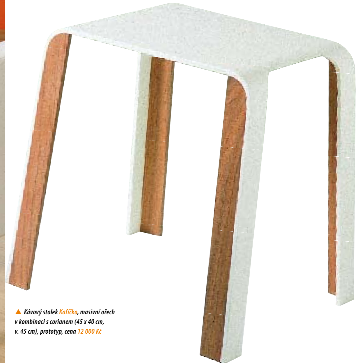
▲ Kávový stolek Kafičko , masivní ořech v kombinaci s corianem (45 x 40 cm, v. 45 cm), prototyp, cena 12 000 Kč