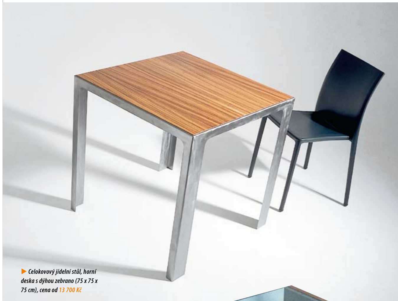
► Celokovový jídelní stůl, horní deska s dýhou zebrano (75 x 75 x 75 cm), cena od 13 700 Kč