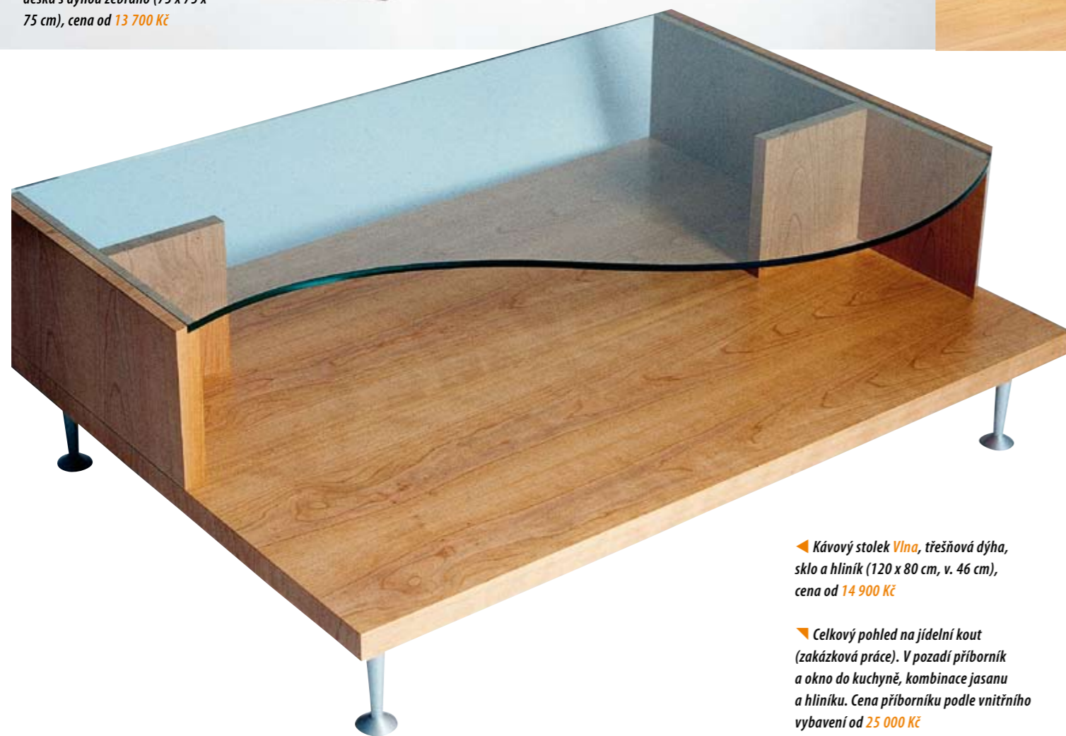
◀ Kávnový stolek Vlna, třešňová dýha, sklo a hliník (120 x 80 cm, v. 46 cm), cena od 14 900 Kč